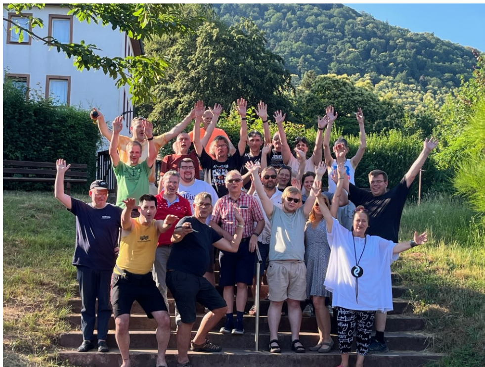
Mainzer Vereinswochenende 2023.